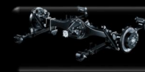
Suspensión trasera con ballestas