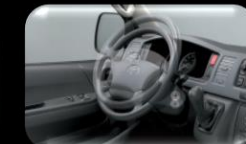
Ajuste del volante