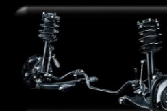
Suspensión Delantera McPherson + Barra estabilizadora