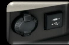
Conector de 110V